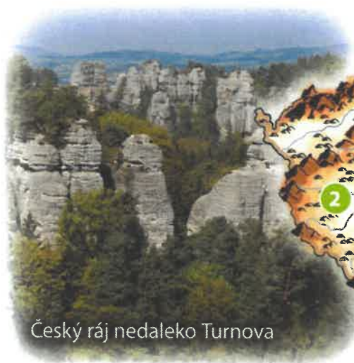
Český ráj nedaleko Turnova

Pojmenuj správně pohoří označená čísly ve slepé mapě ČR.