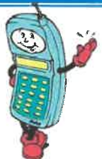
___ cell phone