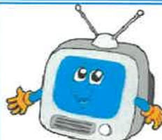
___ TV set