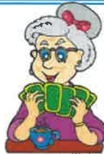
___ old lady