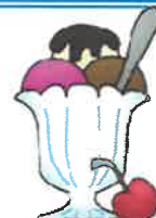
___ ice cream