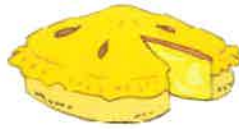
___ apple pie